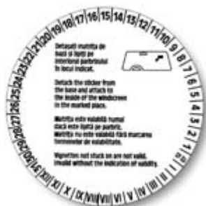
Verso sticker CSA